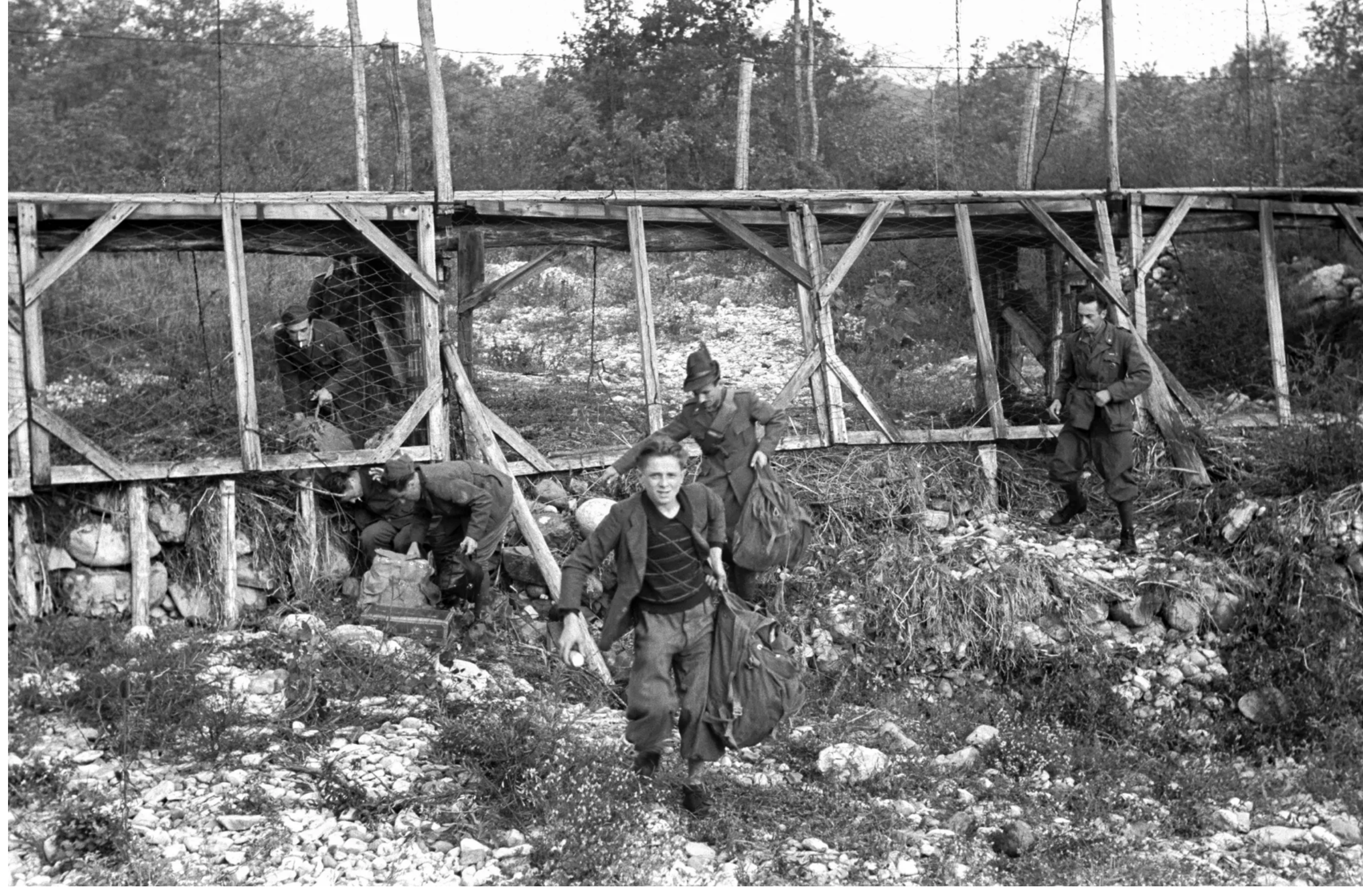
Ab September 1943 plötzlich ein Hotspot der Fluchtbewegungen: Militärflüchtlinge beim Überqueren des Grenzzauns in Stabio im Tessin.