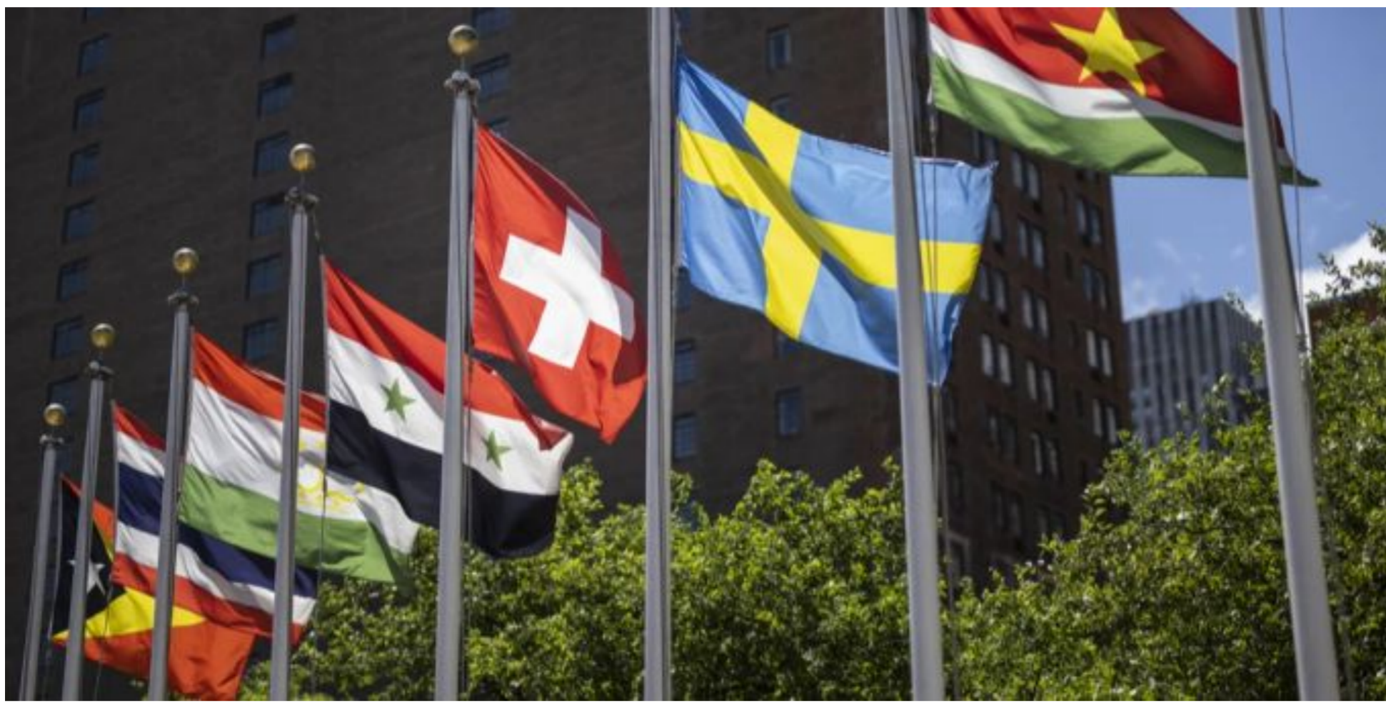
Im Mai 2023 präsidiert die Schweiz den UNO-Sicherheitsrat: Dabei stelle die Neutralität keinerlei Hindernis dar, erklärt Experte Sacha Zala. (Archivbild)

Im Mai 2023 präsidiert die Schweiz den UNO-Sicherheitsrat: Dabei stelle die Neutralität keinerlei Hindernis dar, erklärt Sacha Zala von der Universität Bern.