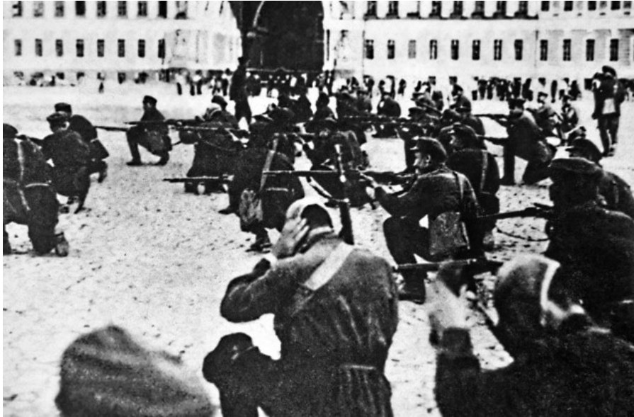
Le 7 novembre 1917, les révolutionnaires lancent l'assaut sur le palais d'Hiver.

Histoire La prise de pouvoir des bolcheviques a eu de nombreux d'impacts sur la Suisse.