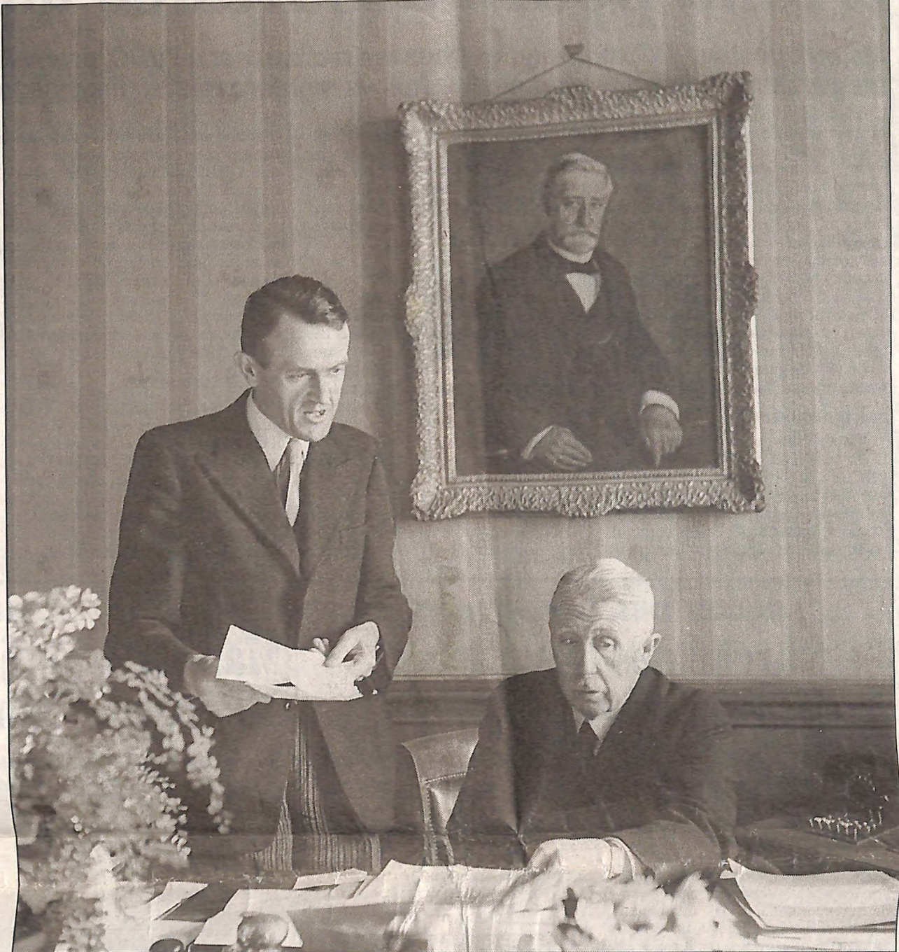
L'ex-conseiller fédéral Max Petitpierre (debout, ici avec son collègue Eduard von Steiger), est en quelque sorte le «héros» du dernier volume de la série des Documents diplomatiques.

Le défi le plus difficile à relever de la part d'un petit Etat, poursuit le directeur de la recherche des DDS, est de conduire une politique de neutralité en dépit des tentations et des pressions internes et externes. La Suisse, de par ses valeurs politico-morales et ses intérêts économiques, n'appartient-elle pas au monde dit libre? Elle finit alors par s'associer au Plan Marshall et à l'organisation européenne de coopération économique. Mais après avoir convaincu Washington qu'elle n'a pas à se soumettre aux mesures de contrôle prévues par l'Admi-