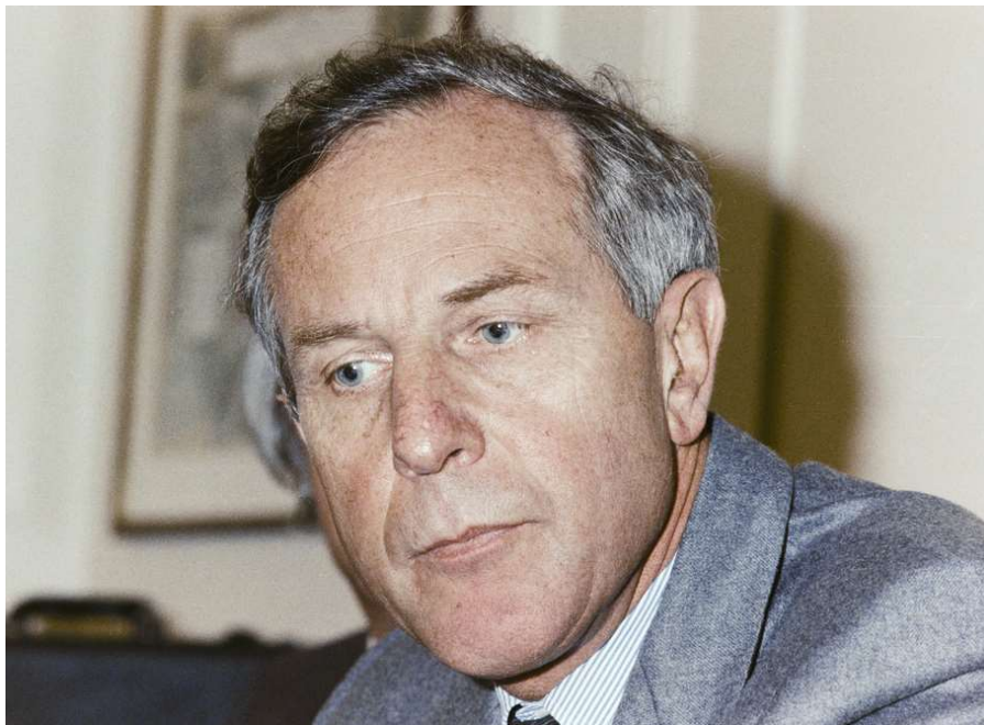
Peter Studer, 1989 nach seiner Wahl zum Chefredaktor des Schweizer Fernsehens.

Beim «Tages-Anzeiger» recherchierte Peter Studer zur Zündergeschichte. Der junge Redaktor und spätere Chefredaktor des «Tages-Anzeigers» sowie des Schweizer Fernsehens beschäftigte sich schon länger mit dem Vietnamkrieg. «Wer die Amerikaner damals hinterfragte, konnte schon Probleme bekommen», erinnert sich Studer heute. Eine konservative Turnergruppe drohte ihm mit einer Abreibung, ein FDP-Nationalrat empfahl ganz klassisch die Reise nach Moskau.