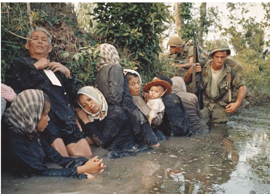
Die vietnamesische Zivilbevölkerung litt stark unter dem Krieg.

Die Geschichte beginnt harmlos, ja erfreulich: Schweizer Uhrenhersteller boomen nach 1945, exportieren fleissig. Sie konkurrenzieren so Unternehmen anderer Länder, auch jene der USA. Die amerikanische Uhrenindustrie beginnt deshalb in Washington zu lobbyieren: Die Politik soll die erfolgreichen Schweizer mit höheren Zöllen zurückdrängen. Ein wichtiges Argument ist dabei die « Defense Essentiality » – die Möglichkeit, die amerikanische Kriegsmaschine im Ernstfall mit den nötigen Rädchen und Teilchen versorgen zu können. Die USA führen die Zölle 1954 tatsächlich ein, heben sie dann aber 1967, in der Hochphase des Vietnamkriegs, wieder auf.