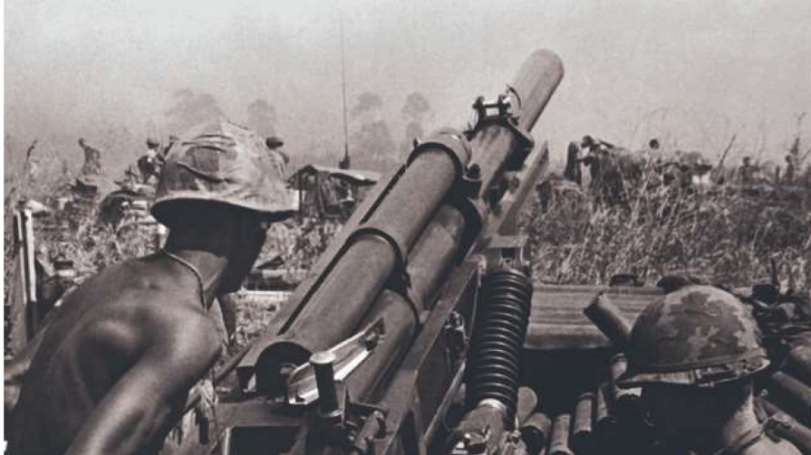
Vietnam im Jahr 1968: Eine amerikanische Artillerie-Abteilung lädt eine Howitzer-Kanone.

Davon wussten selbst Experten nichts: Die hiesige Uhrenindustrie belieferte während des Vietnamkriegs die US-Armee und verdiente damit Millionen.