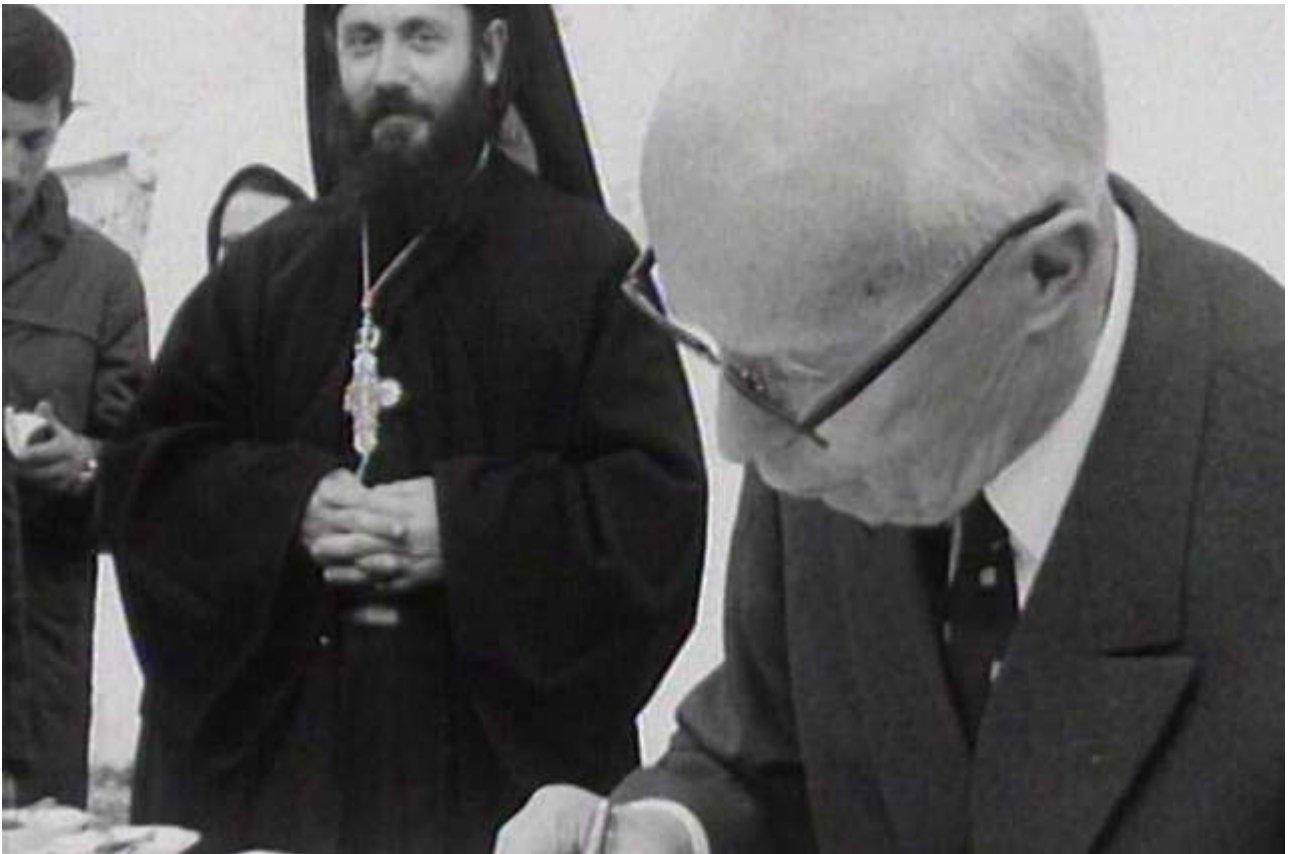
Der Schweizer Aussenminister Willy Spühler besucht das Kloster Cozia in Rumänien.

Im Februar 1969 schlug der rumänische Botschafter Spühler vor, im April sein Land anlässlich einer Schweizer Industriemesse in Bukarest zu besuchen. ☞ Das EPD ergriff diese günstige Gelegenheit : "Ein solcher Besuch würde auch weniger Aufsehen erregen als eine eigentliche Staatsvisite", hiess es.