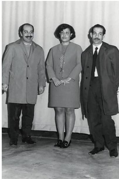
Die drei überlebenden Attentäter, kurz bevor sie die Schweiz am 1. Oktober 1970 verlassen.

Der Ton der Protestnoten, insbesondere jener an die arabischen Länder, ist sehr hart. Den drei Ländern wird vorgeworfen, die Aktivitäten terroristischer Organisationen auf ihrem Territorium toleriert zu haben. "Diese in diplomatischen Beziehungen ungewöhnliche Aktion erfolgte zweifellos aus innenpolitischen Gründen", sagt Zala. Die ☞ Antwort der arabischen Diplomaten fällt ebenso hart aus.