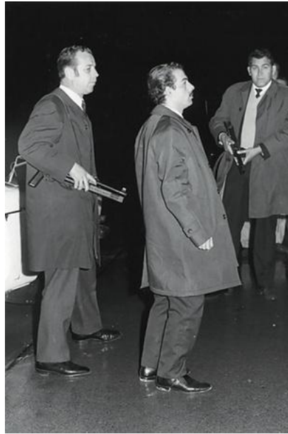
Zwei Schweizer Polizisten eskortieren Mohamed Abu el Heiga am 1. Oktober 1970.

Die folgenden Monate scheinen zu bestätigen, dass Grund zur Angst besteht. Am 21. Februar 1970 explodiert ☒ über Würenlingen ein Flugzeug der Swissair. Alle 47 Insassen des Flugzeugs sterben. In Wahrheit handelt es sich nicht um einen gezielten Akt gegen die Schweiz; die Paketbombe ist eigentlich für ein El-Al-Flugzeug bestimmt und landet versehentlich in der Schweizer Maschine in Richtung Tel Aviv. Aber die Schweiz fühlt sich nun endgültig im Visier des Terrorismus.