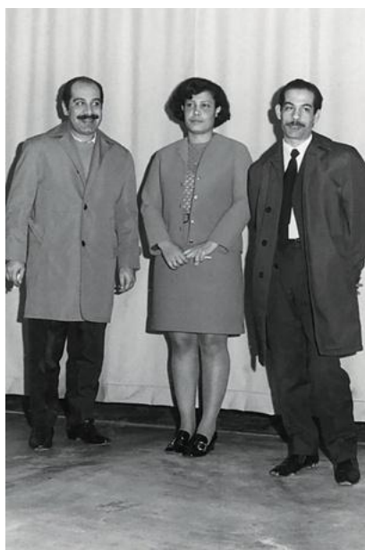
Los tres atacantes antes de salir de Suiza hacia El Cairo el 1 de octubre de 1970.

El tono de las notas, especialmente las dirigidas a los países árabes, es muy duro. Se acusa a los tres países de haber tolerado las actividades de organizaciones terroristas en su territorio. "La acción, inusual en las relaciones diplomáticas, es sin duda dictada por razones de política interna", dice Sacha Zala. La 🔗 réplica de los diplomáticos árabes es igualmente dura.