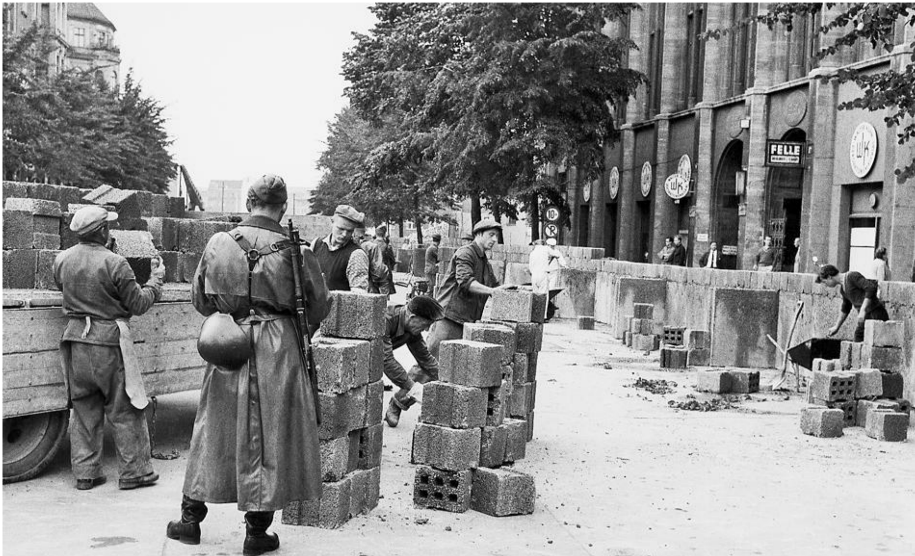
Le 13 août 1961 au matin, des ouvriers est-allemands entament la construction du Mur qui divisera la ville jusqu'en novembre 1989.